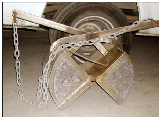
Draga Van Veen de 50 litros de capacidad

Esgemar cuenta con varios tipos de tamaño para este sistema toma muestras: 5, 12 y 50 litros.